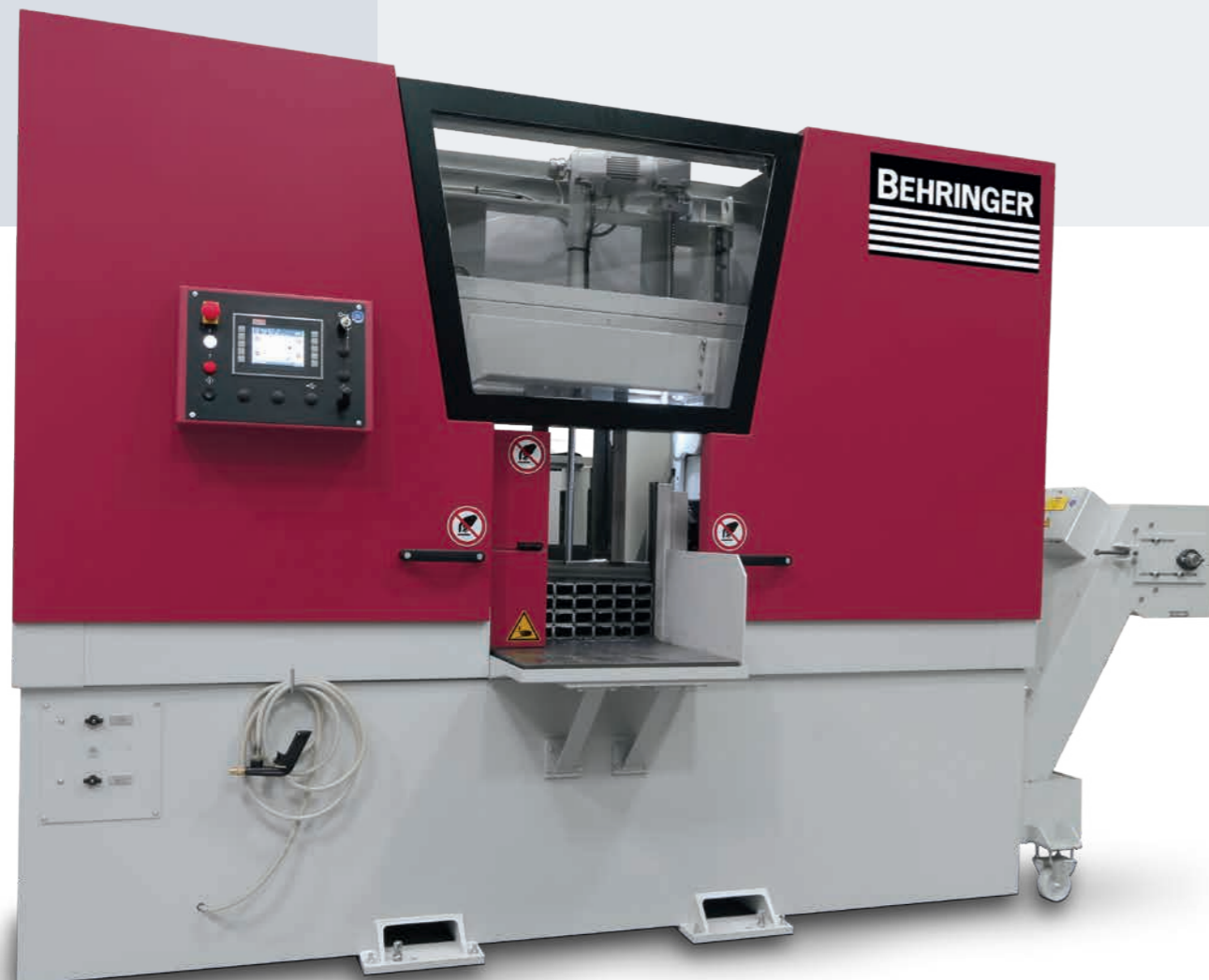
BEHRINGER HBE411A Dynamic