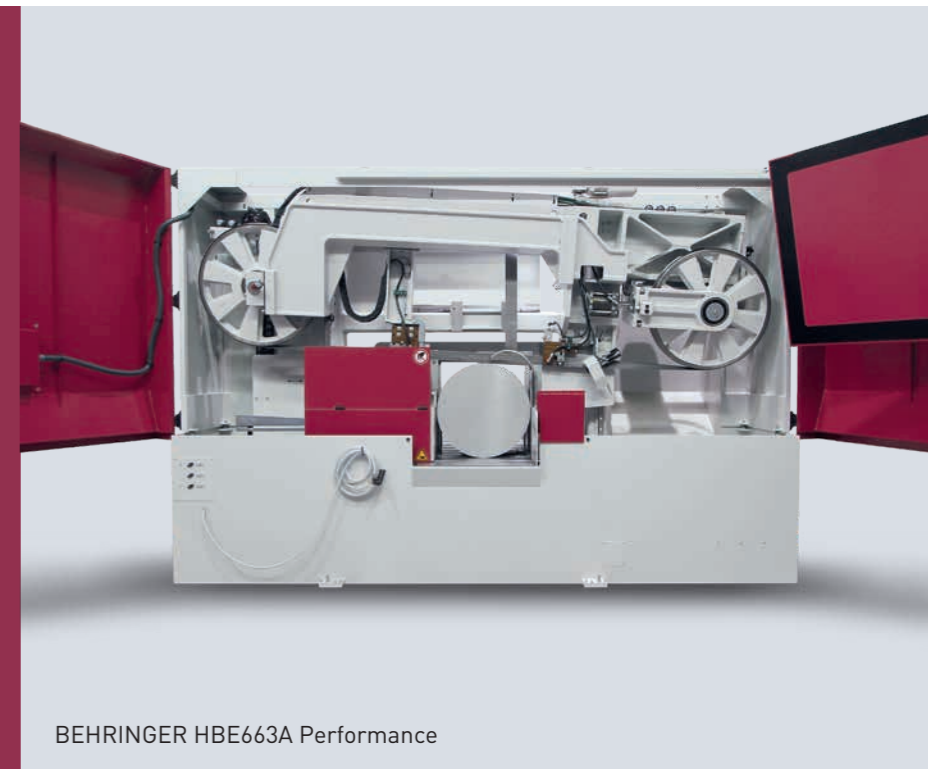
BEHRINGER HBE663A Performance