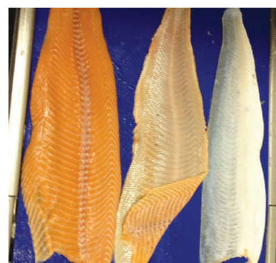
3 produits en 1 opération (ici : saumon)

Machines conçues et fabriquées en FRANCE