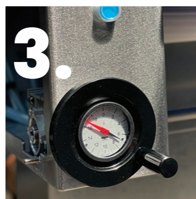
Le volant positionné sur la machine permet à l'utilisateur de régler l'épaisseur de coupe rapidement et simplement.