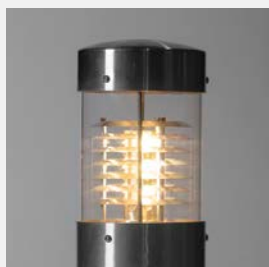
DEL, Acier inoxydable, verre acrylique transparent