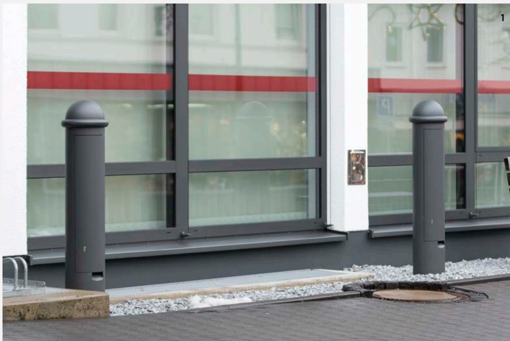
1 BORNE D'ALIMENTATION 300-2