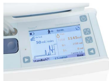
Données objectives et précision

La surveillance permanente des fuites d'air, de la pression et des niveaux de fluides contribue à l'efficacité de la gestion du traitement. Ces paramètres sont affichés sur l'écran en temps réel et sur les dernières 72 heures. Les données sur l'évolution thérapeutique peuvent être téléchargées, évaluées et ajoutées dans le dossier médical du patient. Les informations du Thopaz+ fournissent les indications nécessaires pour la décision du retrait du drain.