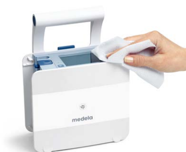
Hygiénique et compact

Thopaz+ simplifie le drainage cardiothoracique tout en présentant des fonctions élaborées. L'écran couleur et les instructions détaillées permettent une utilisation intuitive. De plus, sa structure compacte simplifie le nettoyage et facilite le rangement.