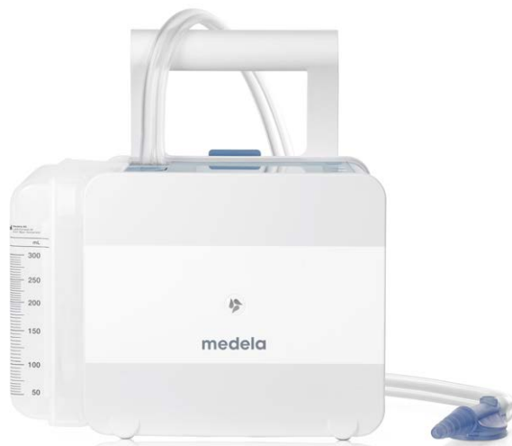
Système de drainage cardiothoracique

UNE THÉRAPIE INTELLIGENTE. DES SOINS OPTIMISÉS