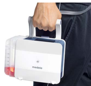
Possibilité de Fast Track pour le patient

Compte tenu du faible poids de l'unité, le design compact et le fonctionnement sur batterie, le patient retrouve rapidement sa mobilité. Il apprécie cet appareil pour son fonctionnement silencieux et son écran à variation d'intensité automatique. Le patient se sent davantage en confiance et en sécurité grâce au système de notifications.