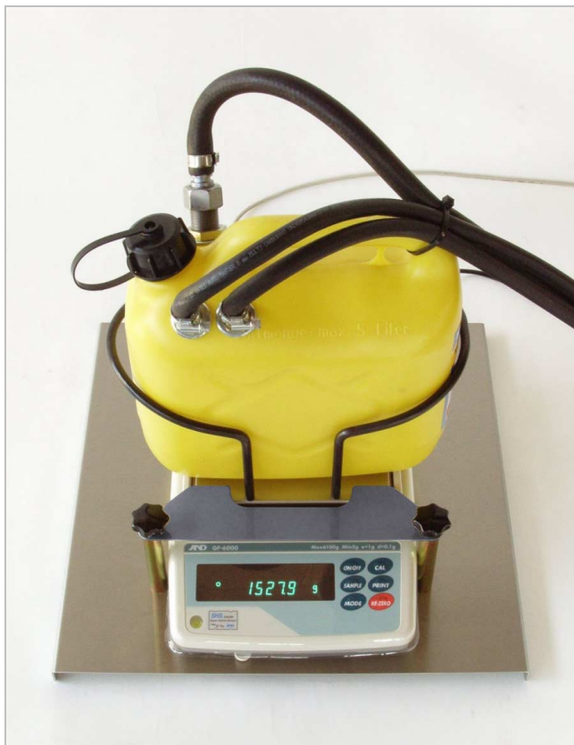
Balance de précision pour des réservoirs de 5 l ...