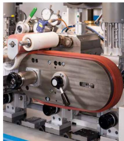
Unité d'impression avec tampon type courroie

La CONTINUOUS CIRCULAR a une capacité de 15.000 pièces/heure – selon les pièces à marquer.