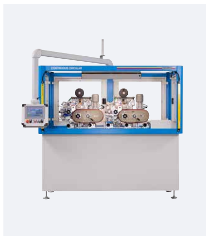
CONTINUOUS CIRCULAR avec 2 unités d'impression

La CONTINUOUS CIRCULAR est disponible en une et plusieurs couleurs. Avec cette nouvel-