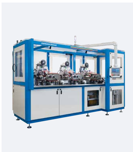
CONTINUOUS CIRCULAR avec 3 unités d'impression

La CONTINUOUS CIRCULAR avec son impression à 360° convainc par sa précision. Le procédé d'impression en continu assure un contrôle constant et donc une meilleure qualité et une plus grande précision que les solutions classiques.